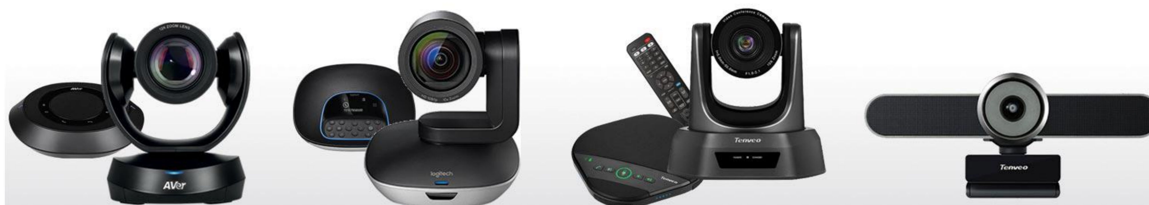
جدول فنی وبکم های کنفرانس